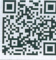
500 ม.